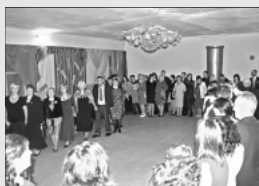
Viļakas novadā aizvada Skolotāju dienu.