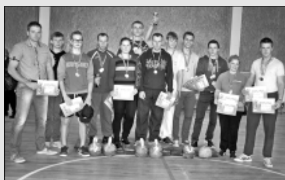
Svarbumbu cēlāji uzrāda labus rezultātus.