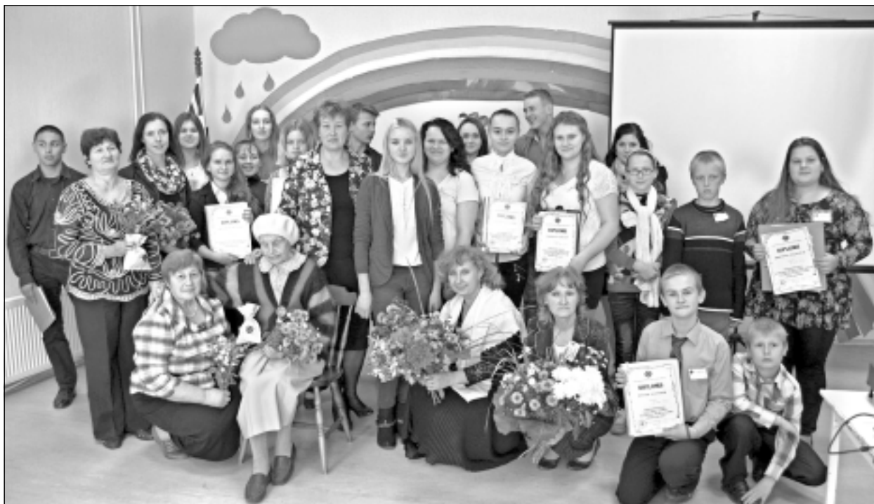
Kopbilde. Mazpulku starpnovadu skates noslēgumā tās dalībnieki pulcējās kopīgam fotomirklim.

Katrs mazpulcēns par izstrādāto un aizstāvēto darbu saņēma Pateicības rakstu. Žūrija nolēma, ka uz Latgales Forumu brauks